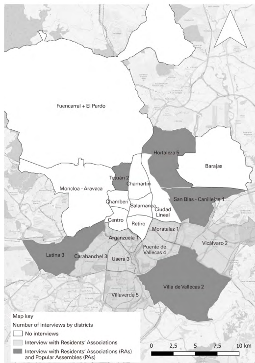
FIGURE 1. Spatial distribution of interviews conducted in neighbourhoods categorised as vulnerable

neighbourhoods are classified as vulnerable or not was defined by identifying urban areas with high levels of unemployment, poorer housing quality, concentration of population with low level of education, low professional qualifications, degradation of public spaces, etc. (Alguacil, 2006; Alguacil, Camacho and Hernández, 2013; Observatorio Metropolitano, 2007, 2009; Temes, 2014; Uceda, 2016; Fernández et al. , 2018). This was illustrated, according to data from the Madrid City Council, by the two-year difference in life expectancy between the districts of Chamartín (86.7 years) and Villa de Vallecas (84.3 years), the difference in registered unemployment rate between Puente de Vallecas (13.0%) and the district of Salamanca (6.3%), and the average household income in Puente de Vallecas (25500€) compared to Chamartín (65900€).