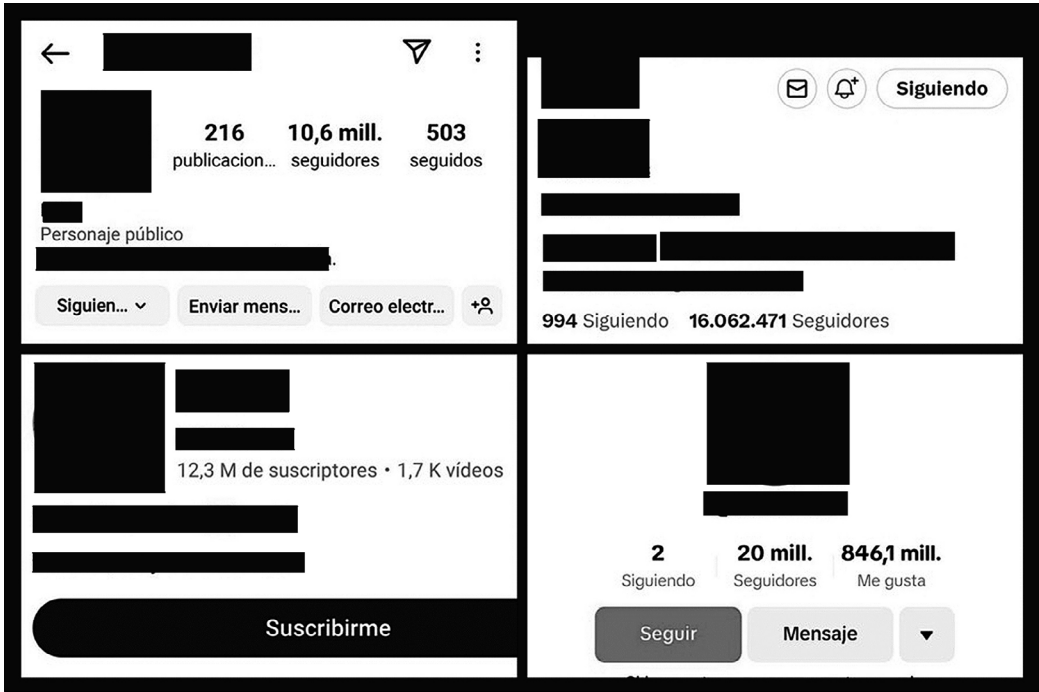
IMAGEN 1. Capturas de pantalla de la interfaz de las cuentas en Instagram, Twitter, Youtube y Tiktok (anonimizadas). Las métricas relativas al número de seguidores dominan el espacio visual en todas ellas